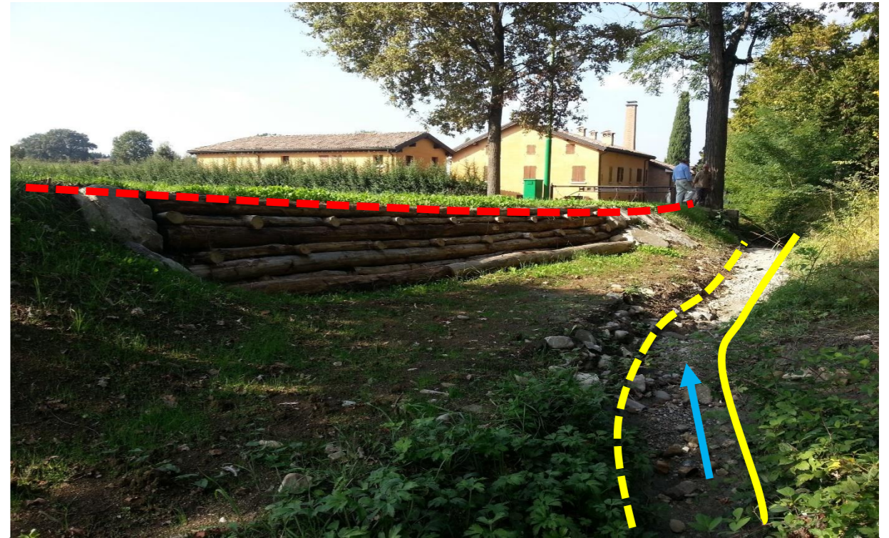
Unità morfologiche rilevate il 02/10/2014. In giallo continuo la sponda destra, in giallo tratteggiato la sponda sinistra pre intervento, in rosso la sponda sinistra arretrata.