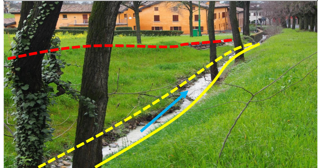
Sito di intervento durante il rilievo del 30/03/2015. In giallo continuo la sponda destra, in giallo tratteggiato la sponda sinistra pre intervento, in rosso la sponda sinistra arretrata.