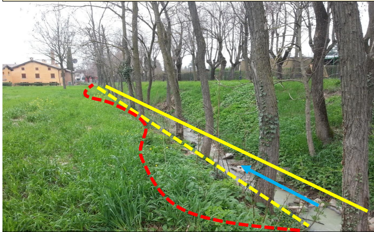
Sito di intervento Ante Operam (09/04/2013). In giallo continuo la sponda destra, in giallo tratteggiato la sponda sinistra pre intervento, in rosso la sponda sinistra arretrata.