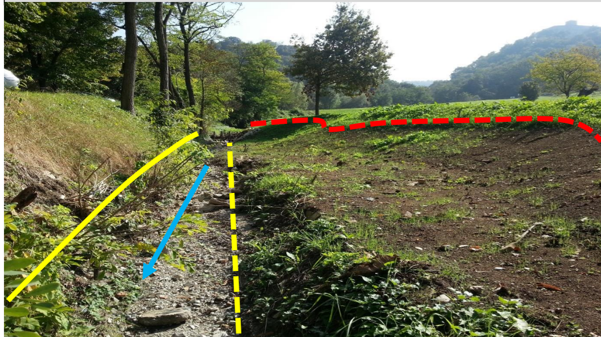
Unità morfologiche rilevate il 02/10/2014. In giallo continuo la sponda destra, in giallo tratteggiato la sponda sinistra pre intervento, in rosso la sponda sinistra arretrata.