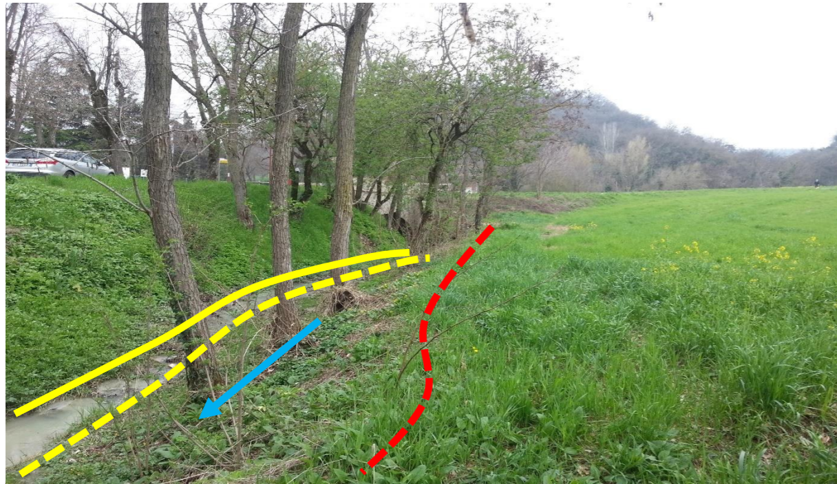
Sito di intervento Ante Operam (09/04/2013). In giallo continuo la sponda destra, in giallo tratteggiato la sponda sinistra pre intervento, in rosso la sponda sinistra arretrata.