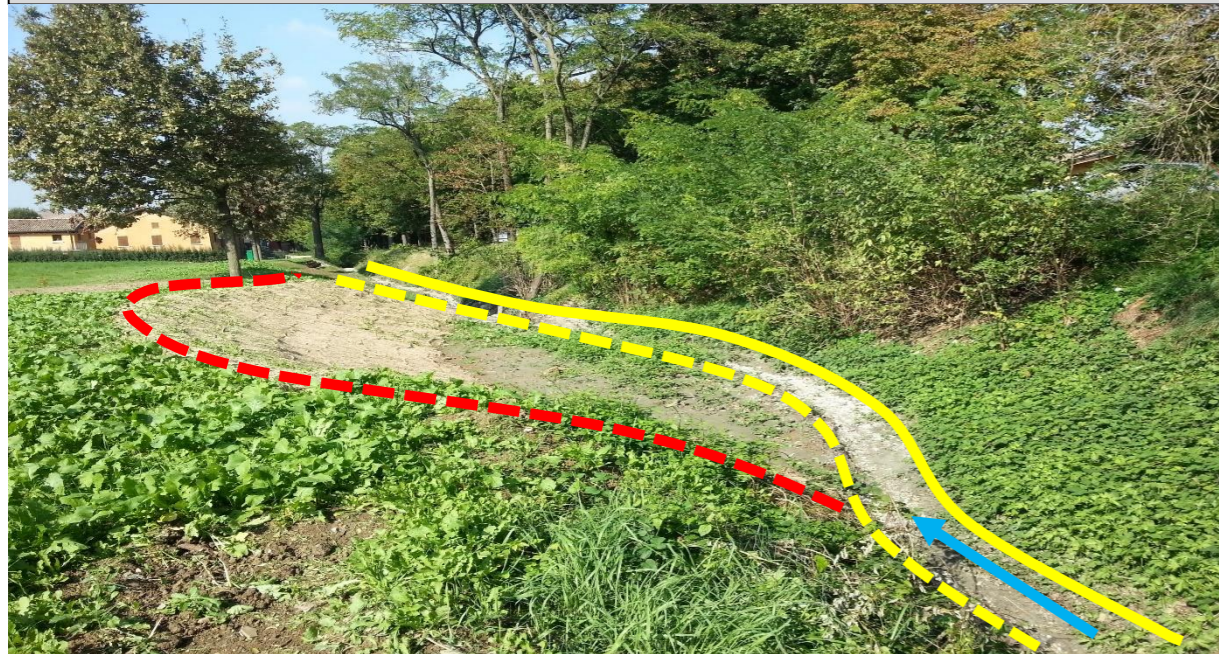
Sito di intervento durante il rilievo del 02/10/2014. In giallo continuo la sponda destra, in giallo tratteggiato la sponda sinistra pre intervento, in rosso la sponda sinistra arretrata.